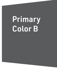
Primary Color B