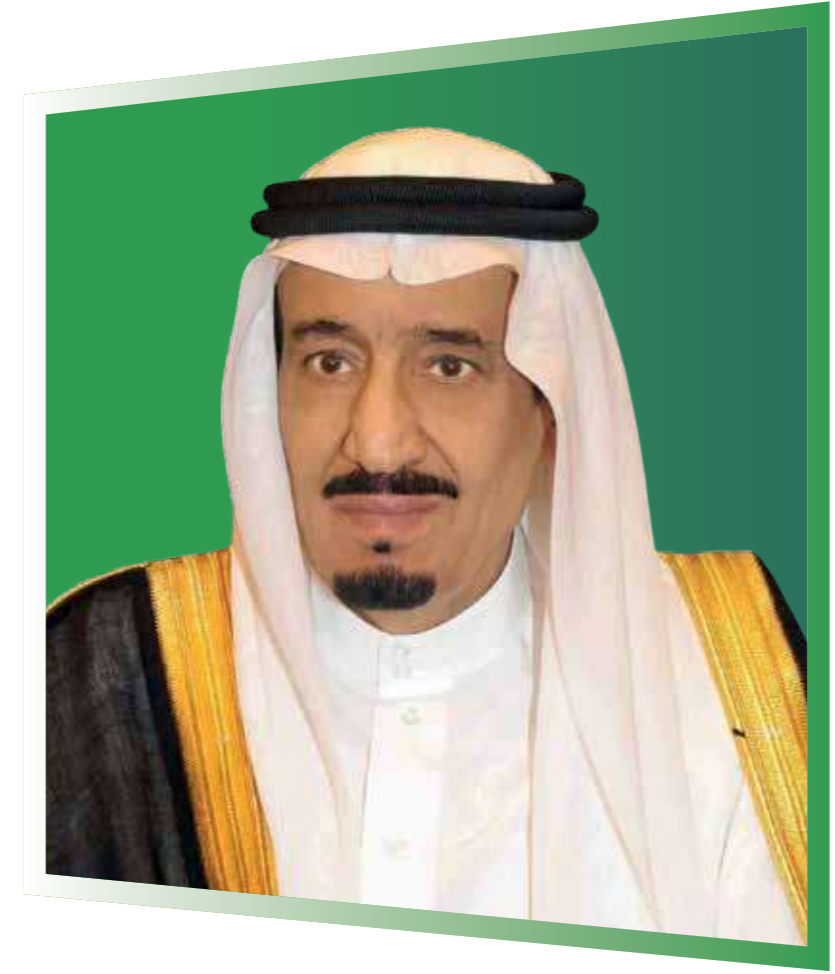
خادم الحرمين الشريفين الملك سلمان بن عبد العزيز آل سعود