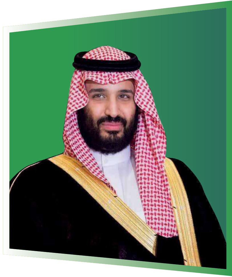
ولي العهد ونائب رئيس مجلس الوزراء وزير الدفاع صاحب السمو الملكي الأمير محمد بن سلمان